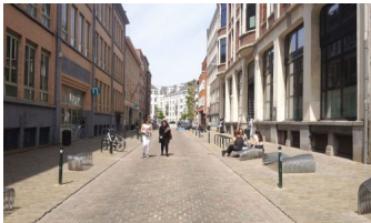
Rue de la Braie