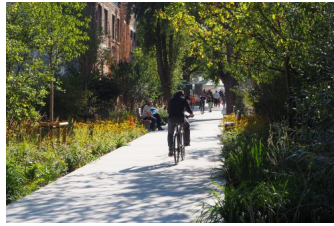
Parc de la Senne