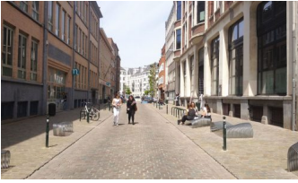
Rue de la Braie