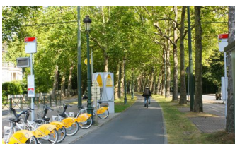
Boulevard du Souverain