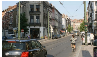
Rue de la Brasserie