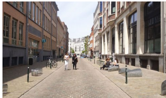
Rue de la Braie