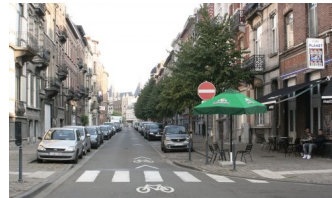
Rue Henri Bergé